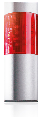
Der optisch-akustische Signalgeber von TELENOT verfügt über die höchste Sicherheitsklasse VdS-Klasse C.

Dieser Alarm wird über eine automatische Übertragungseinrichtung zu einer hilfeleistenden Stelle übertragen – beispielsweise zu einem Wachdienst. Diese Stelle kann dann reagieren und Maßnahmen zur Gefahrenabwehr treffen. Ebenso kann der Alarm auf ein oder mehrere Smartphones übertragen werden.