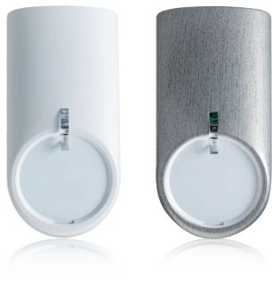
In verschiedenen Designcovers erhältlich: der Bewegungsmelder comstar VAYO.

Ein weiterer Vorteil der TELENOT-Alarmanlage: Sie ermöglicht die Scharfschaltung einzelner Räume oder Raumbereiche, sodass die Anlage bei Anwesenheit aktiviert werden kann. Insofern kann auch nach Geschäftsschluss weiter gearbeitet werden.